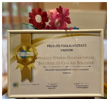
A Mohácsi Térségi Óvodaközpont felelős foglalkoztató oklevele

„Nagyon nagy megtiszteltetésnek érzem az arany fokozat elérését. Ez ad lendületet és motivációt számunkra arra, hogy továbbra is alázattal és felelősségteljesen végezzük a munkánkat.”